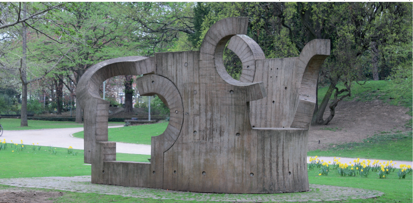
Oben: Peine del Viento (Windkamm), 1977, San Sebastián/ Donostia Unten: La casa de Goethe (Das Haus von Goethe), 1986, Frankfurt

Kunstgeschichtliches Institut Johann Wolfgang Goethe-Universität, Frankfurt a.M. kunstgeschichte@kunst.uni-frankfurt.de www.kunst.uni-frankfurt.de